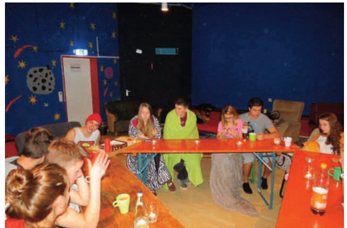
Das Leben „offline“ und gemeinsam macht oft viel mehr Spaß, als das was Jugendliche heutzutage als normal empfinden.

Erst durch den Verzicht wurde so manchen Jugendlichen erst bewusst, wie intensiv sie normalerweise ihr Handy nutzen. So musste eine Jugendliche am Ende der Veranstaltung feststellen: „Wie krank ist das denn!“ Und zeigt nach dem Anschalten (nach „nur“ 27 Stunden) ihres Handys auf das Display, das da 789 WhatsApp-Nachrichten meldete. Die Selbsterkenntnis war: „Ich wusste, dass ich viel auf WhatsApp schreibe - Mir war aber nicht bewusst, dass es so viele Nachrichten täglich sind. Wir raten einfach mal öfters das Handy ausschalten! (Dies gilt auch für Erwachsene) ;)