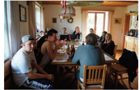
Beim Mitbestimmerkreis im November wurde konzentriert die Jahresplanung 2015 in Angriff genommen.

Hierbei kam das neue Musikterminal an unserer Theke zum Einsatz. Über ein Tablet wird die Musik via WLAN direkt aus dem Internet ausgewählt, gestreamt und auf unserer Musikanlage abgespielt. Dadurch kann nun immer aktuelle Musik von den Jugendlichen gehört werden, ohne darauf warten zu müssen bis wir diese auf CD haben. Natürlich streamen wir nur legal als Premiummitglied vom Musikportal unseres Vertrauens.